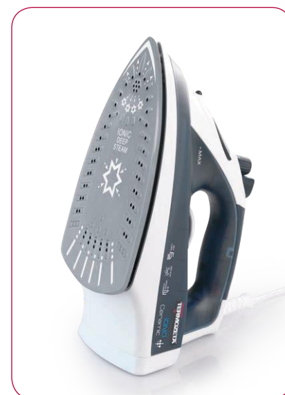
Piastra con rivestimento in CERAMICA